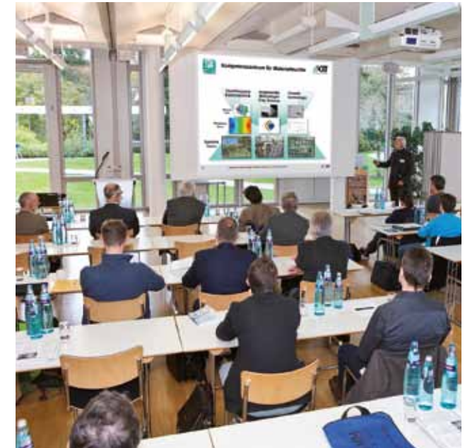
Tagung 2015 im Akademie Hotel Karlsruhe